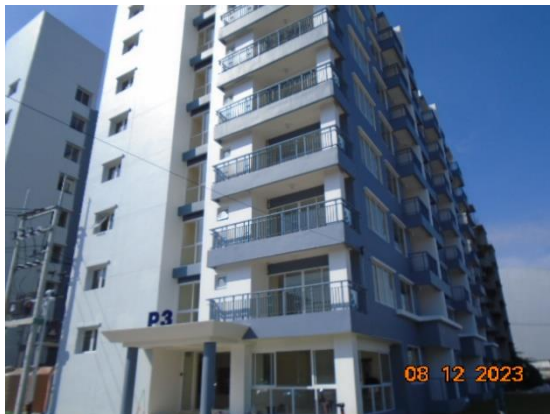
รูปที่ 1-1 สภาพโครงการในปัจจุบัน