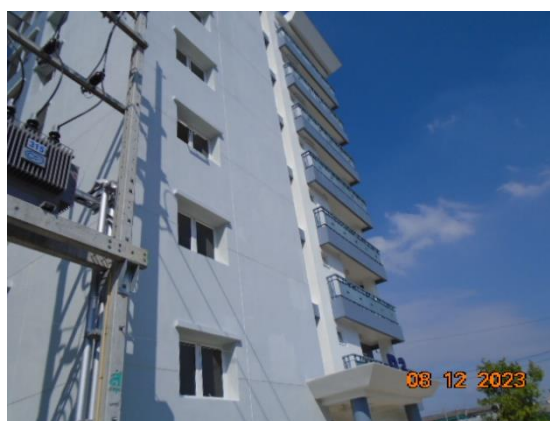
รูปที่ 1-4 การดำเนินงานในปัจจุบัน